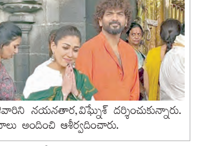
తిరుమల, ఏప్రిల్ 9 ప్రభాతవార్త ప్రతినిధి: తిరుమల ప్రజలందరికీ మంచి జరగాలని, సుఖసంతోషాలతో ఉండాలని వేడుకున్నట్లు సినినటి నయనతార, దర్శకుడు విశ్వప్రకాష్ జెన్ దంపతులు తెలిపారు. స్వామీవారి ఆశీస్సులందుకుంటే మనసు ఎంతో ఆనందంగా ఉంటుందిన్నారు. గురువారం ఉదయం కుటుంబసభ్యులతో కలిసి తిరుమల శ్రీవారిని నయనతార, విశ్వప్రకాష్ దర్శించుకున్నారు. ఆయన అధికారులు వారికి స్వామీవారి తీర్పు ప్రసాదాలు అందించి ఆకర్షించారు.