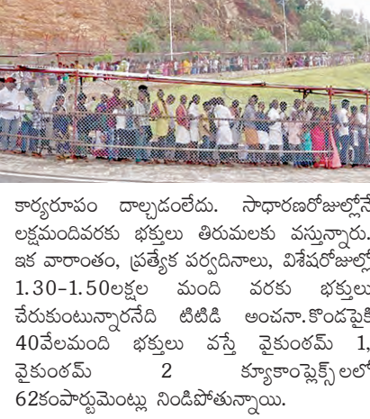
కార్యరూపం దాల్చుదలచేను. సాధారణజాతిని లక్ష్యంపెట్టిన భక్తుల తిరుమలకు వస్తున్నాను. ఇక వారంతం, ప్రత్యేక వర్కడినాలు, విశేషార్జున్ల 1.30-1.50లక్షల మంది వరకు భక్తులు చేరుకుంటున్నారనేది డిటిడి అంచనా. కొండపైకి 40వేలమంది భక్తులు వస్తే వైకుంఠమ్ 1, వైకుంఠమ్ 2 క్యూఆంప్లెక్స్ లలో 62కంపార్టుమెంట్లు నిందిపోతున్నాయి.

తిరుమల, ఏప్రిల్ 9 ప్రభాతవార్త ప్రతినిధి: రోజూ వారిగా సరాసరి లక్షమంది వరకు భక్తులు... సుమారుగా 80వేలమంది ఆ దేవదేవని దర్శనం చేసుకుంటుండటం ప్రత్యేకత. పెద్ద సంఖ్యలో భక్తులు తరలివచ్చి ఇక ఆ అదనపు కూర్చోమట్లు అయి వెలువల నాలుగు కిలో మీటర్లు నిందిపోయి శిలాతోరణం, పాప విినాశనమ్ మార్గం వరకు వ్యాపిస్తున్నాయి. రోజూ భక్తులు తిరుమలకు వస్తున్న భక్తుల సంఖ్య అనూహ్యంగా రెట్టింపువుతుండటంతో తిరుమలలో వెలువల కిలోమీటర్లకూర్చోమట్లను స్వయంలకడానికీ వైకుంఠమ్ క్యూఆంప్లెక్స్-3 నిర్మాణం చేయాలనేది ప్రస్తుతం కోసనగుతున్న బోధ్య అలోచన, ఆదికారుల ప్రతిపాదనలు, అయితే గత ఏడాదికాలంగా ఈ ప్రతిపాదనలు